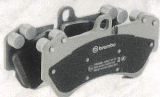
PRIME BRAKE CERAMIC PADS